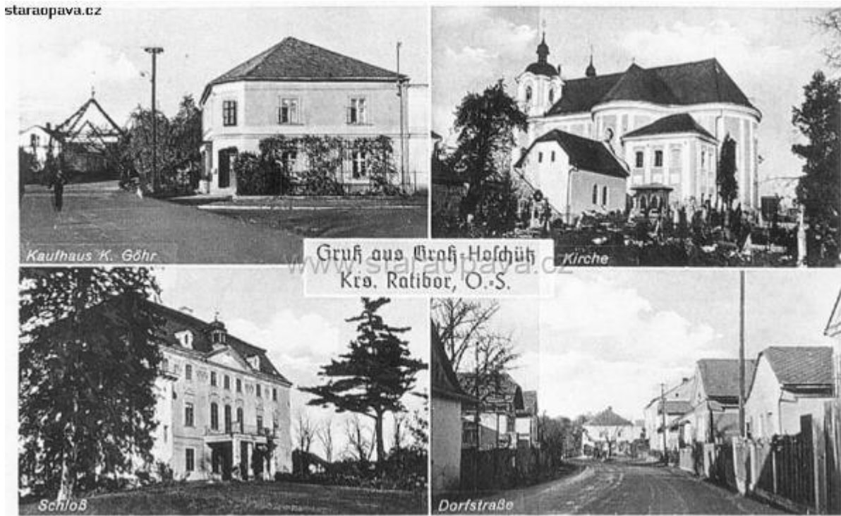
Velké Hoštice v roce 1936