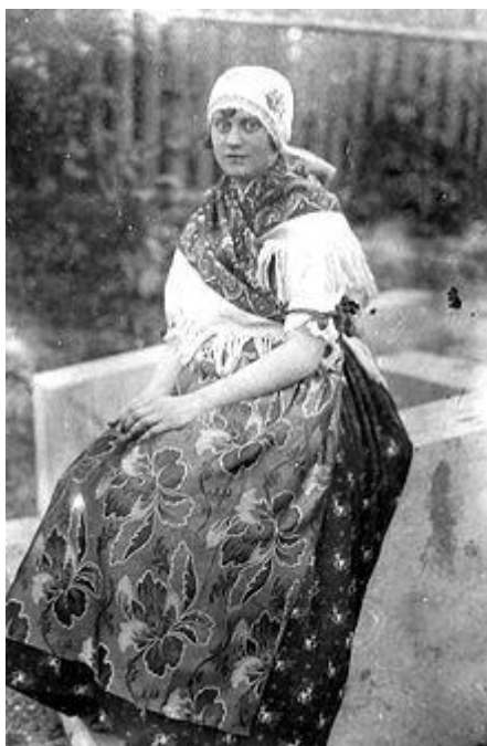
Žena v hlučínském kroji